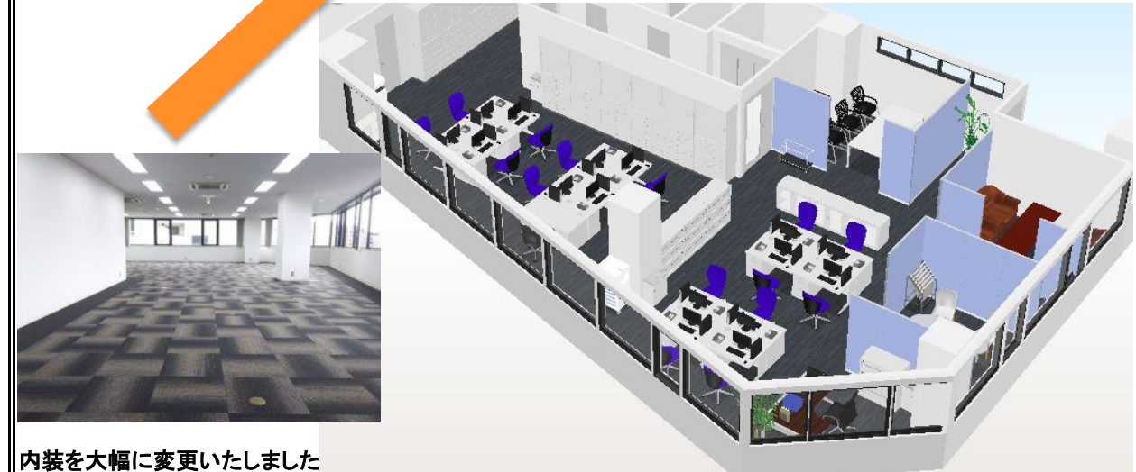
内装を大幅に変更いたしました