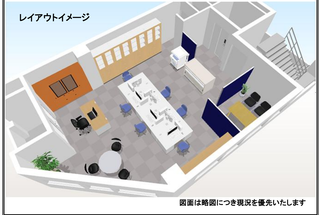
図面は略図につき現況を優先いたします