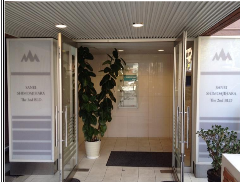
エントランス(東側)