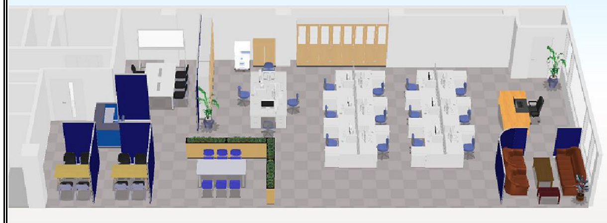
レイアウトイメージ

※上記賃料共益費には消費税が含まれておりませんので別途御負担願います。 ※設備等は貸室により若干異なる場合がございます。