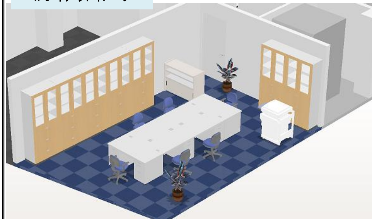
4Fレイアウトイメージ