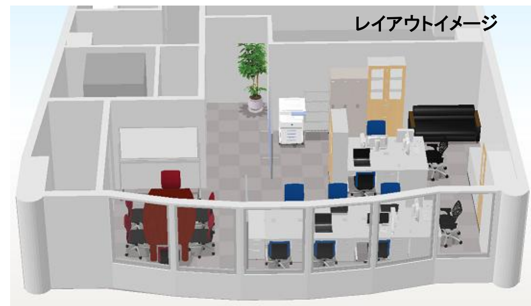
レイアウトイメージ