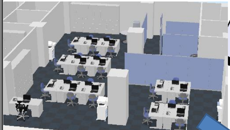
802号レイアウトイメージ